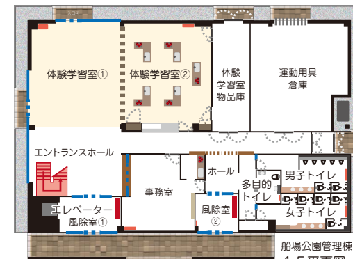
船場公園管理棟 1 F 平面図