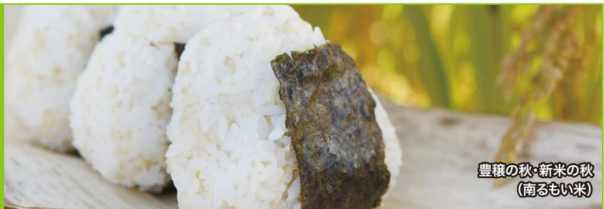
豊穣の秋・新米の秋 (南るもい米)