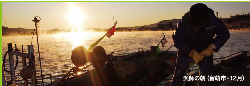
漁師の朝 (留萌市・12月)