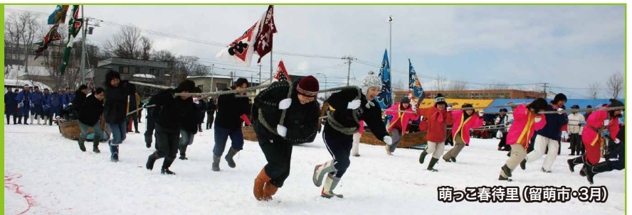
萌っこ春待里(留萌市・3月)