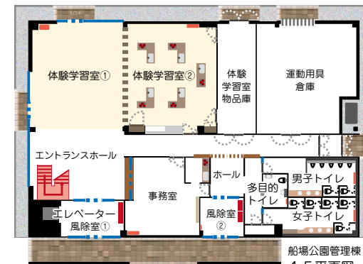
船場公園管理棟 1 F 平面図