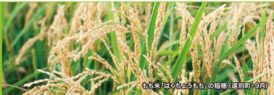
もち米「はくちようもち」の稲穂(遠別町・9月)