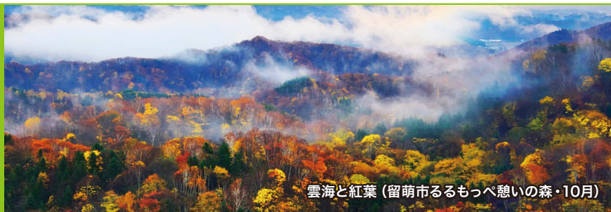
雲海と紅葉 (留萌市るもっぺ憩いの森・10月)