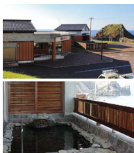
露天風呂からは日本海オロロンライン&夕陽♪