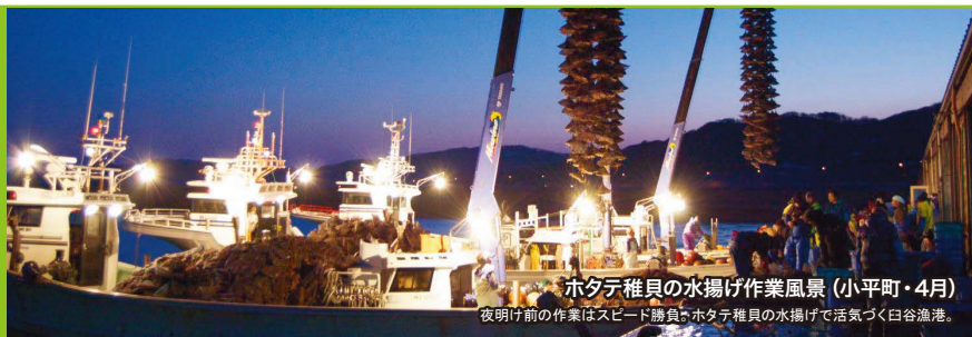
ホタテ稚貝の水揚げ作業風景(小平町・4月) 夜明け前の作業はスピード勝負。ホタテ稚貝の水揚げで活気づく白谷漁港。