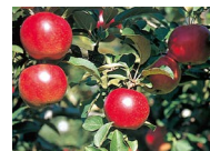
リンゴ (9月中旬~11月上旬頃)

※天候により収穫時期が前後する場合があります。詳しくは増毛町果樹園までお問い合わせください。