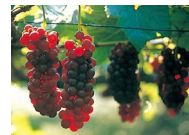
ブドウ (9月上旬~10月下旬頃)