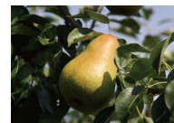
洋ナシ (9月上旬~10月中旬頃)