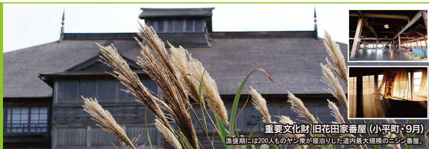
重要文化財 旧花田家番屋 (小平町・9月) 漁盛期には200人ものヤン衆が寝泊りした道内最大規模のニシン番屋。