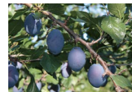
ブルーベリー (9月上旬~10月中旬頃)