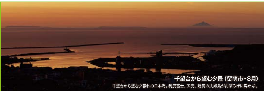
千望台から望む夕景（留萌市・8月）